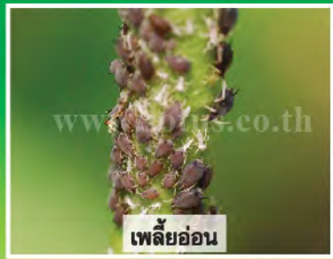
เพลี้ยอ่อน