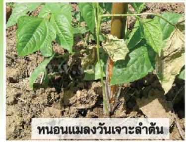
หนอนแมลงวันเจาะลำต้น