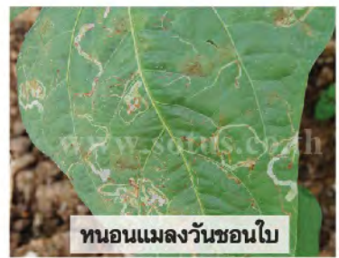
หนอนแมลงวันชอนใบ