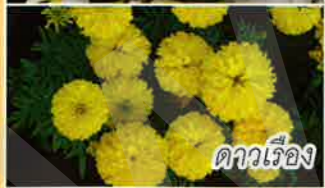
ดาวเรือง