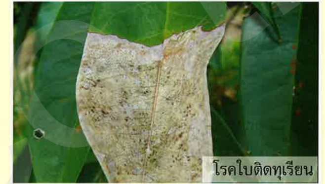
โรคใบดิดทุเรียน