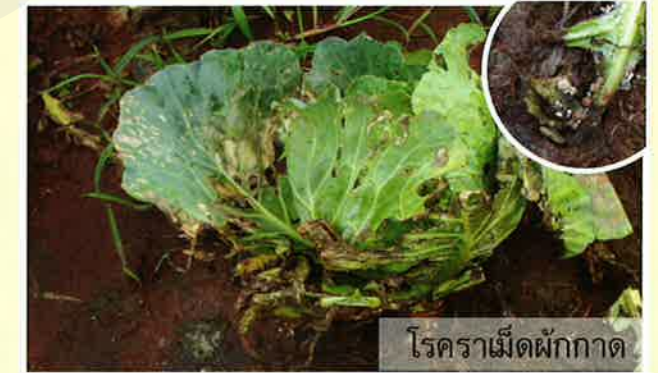
โรคราเม็ดผักกาด