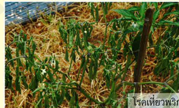
โรคเหี่ยวพริก