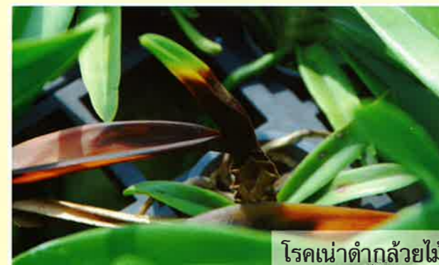
โรคเน่าดำกล้วยไม้