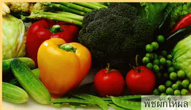
พืชผักให้ผล