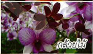
กล้วยไม้