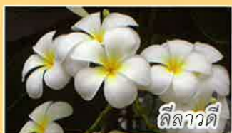
ตีนขาวดี