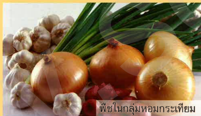
พืชในกลุ่มหอมกระเทียม