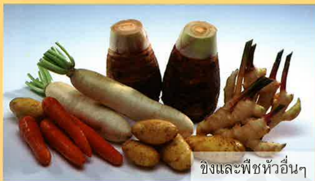
ขิงและพืชหัวอื่นๆ