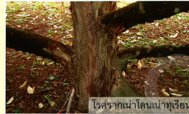
โรครากเน่าโคนเน่าทุเรียน