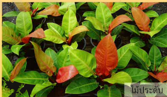
ไม้ประดับ

บริษัท โซตัส อินเตอร์เนชั่นแนล จำกัด www.sotus.co.th อาคารโรดส์ เลขที่ 77 เมืองทองธานี ต.แจ้งวัฒนะ อ.ปากเกร็ด จ.นนทบุรี 11120 โทรศัพท์ 02 984-0999 โทรสาร 02 984-0997-8