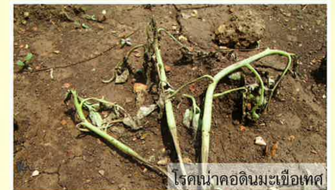
โรคเน่าคอดินมะเขือเทศ