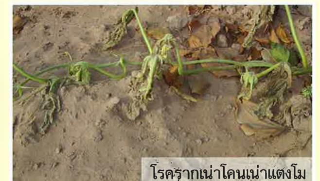
โรครากเน่าโคนเน่าแตงโม