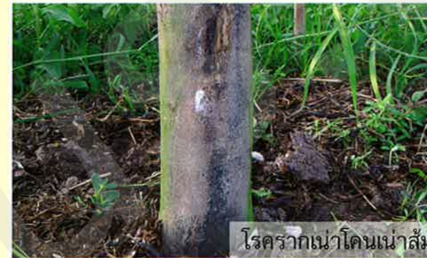
โรครากเน่าโคนเน่าส้ม