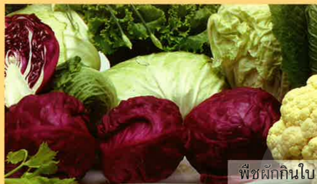
พืชผักกินใบ