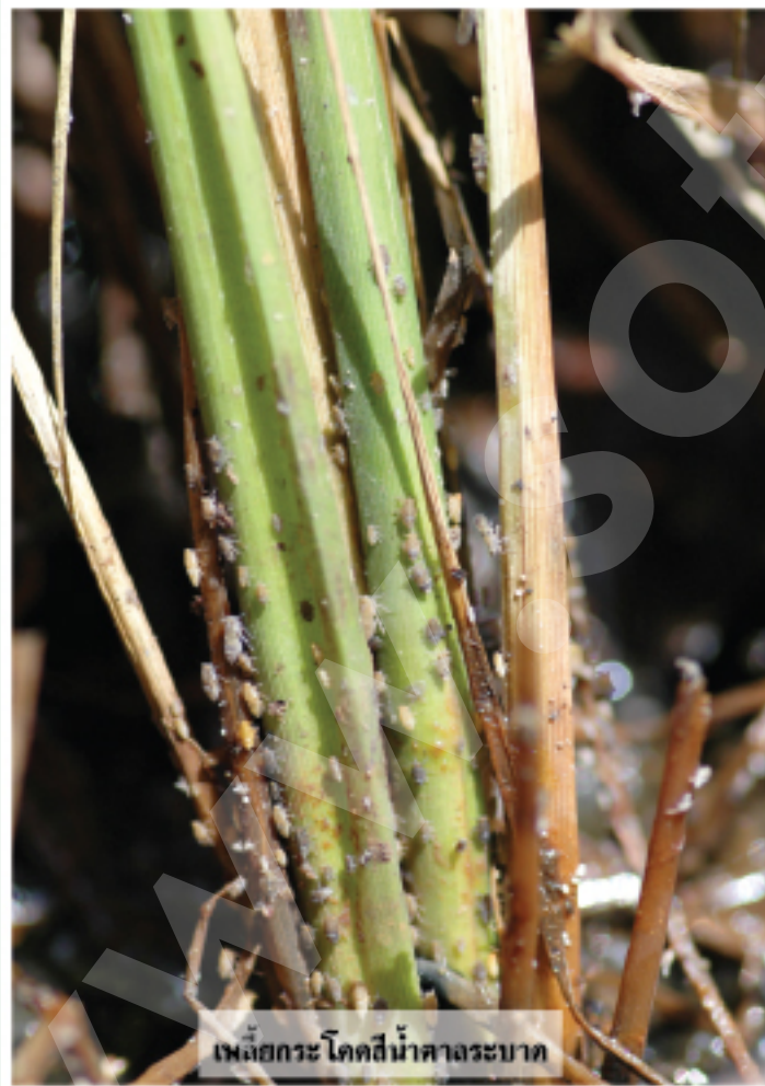
เพลี้ยกระโดดสีน้ำค้างระบาด