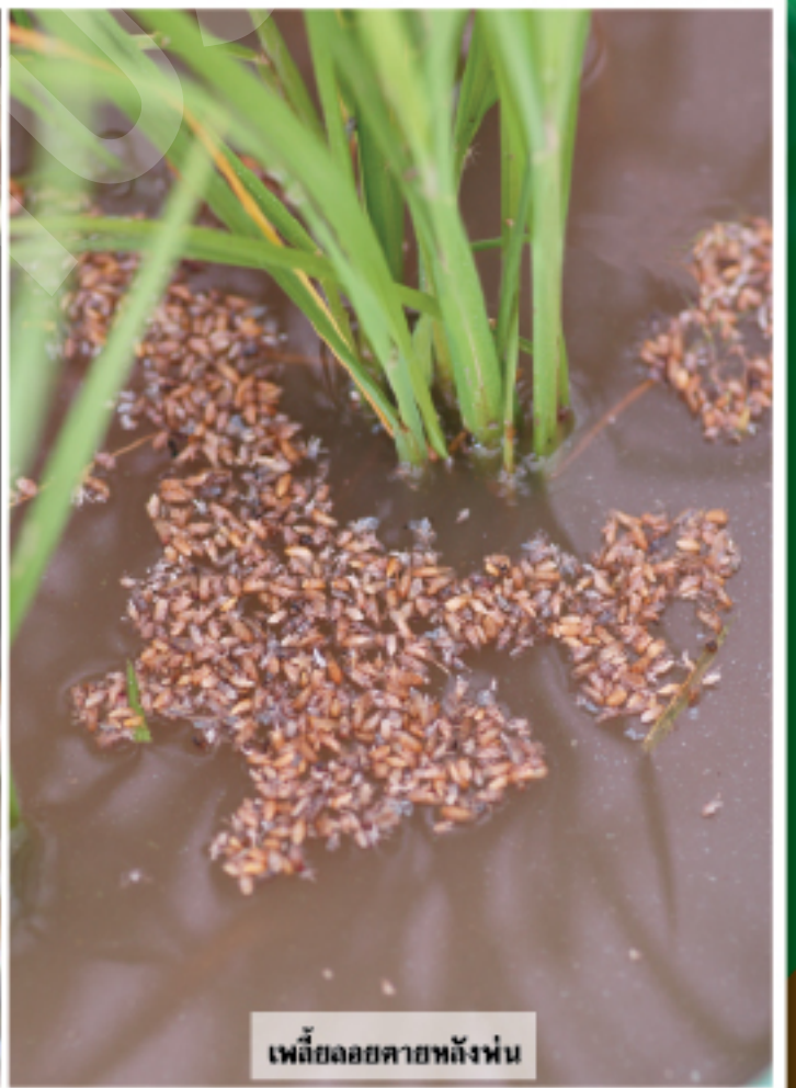
เพลี้ยล่อยตายหลังฝน