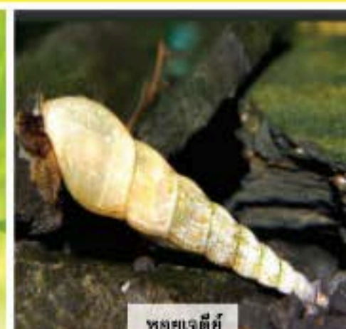
หอยเจดีย์