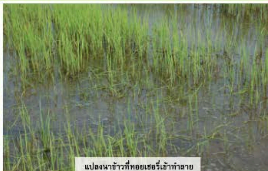
แปลงนาข้าวที่หอยเชอรี่เข้าทำลาย