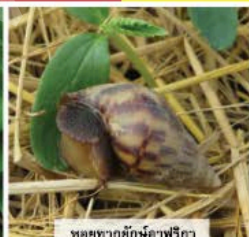
หอยทากยักษ์แอฟริกา