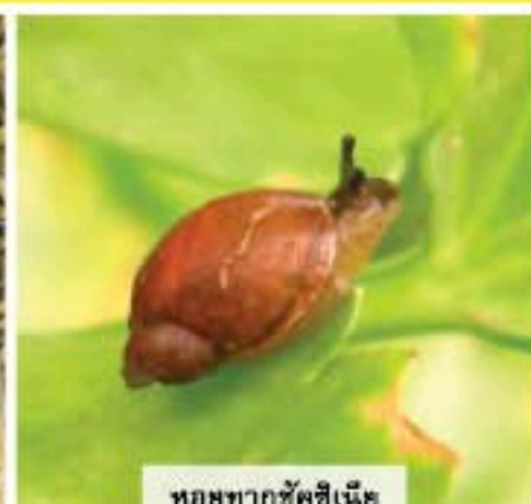
หอยทากซัคซีเนีย