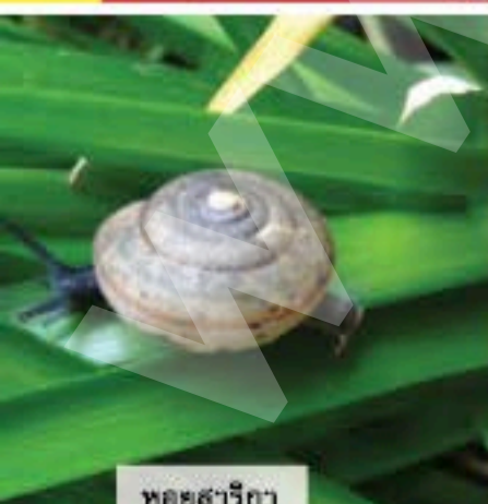
หอยสาริกา