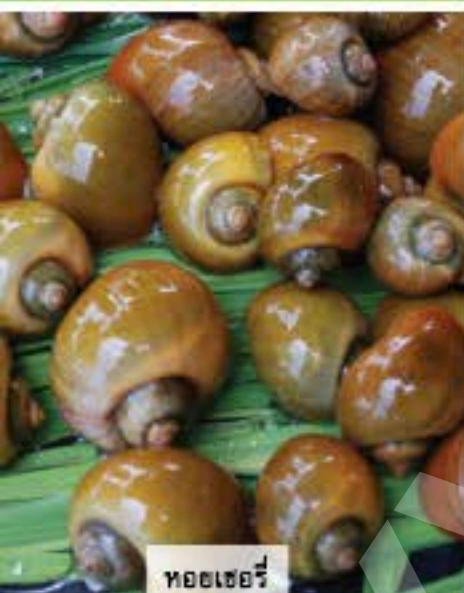
หอยเชอรี่