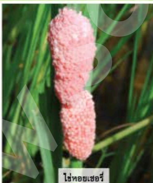
ไข่หอยเชอรี่