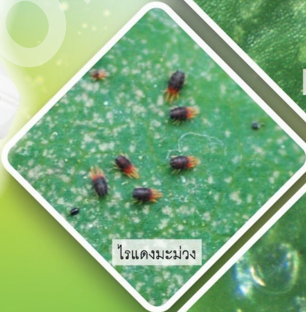
ไรแดงมะม่วง