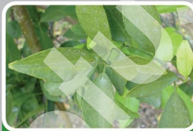
ไรแดงเข้าทำลายใบส้ม ทำให้ใบเหลืองซีด เหงากว้าง