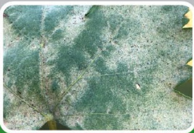
ไรแดงเข้าทำลายในองุ่น

ใช้ โอไมท์ 57 อีดับเบิลยู อัตรา 15 ซีซีต่อน้ำ 20 ลิตร พ่นทุก 2-3 สัปดาห์ เพื่อประสิทธิภาพในการกำจัดไรศัตรูพืช ควรพ่นให้เปียกทั่วทั้งด้านบนและด้านล่างของใบ