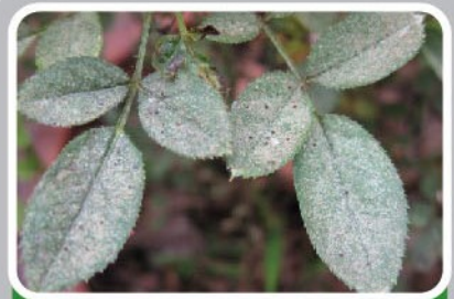
การเข้าทำลายของไรแดงในกุหลาบ