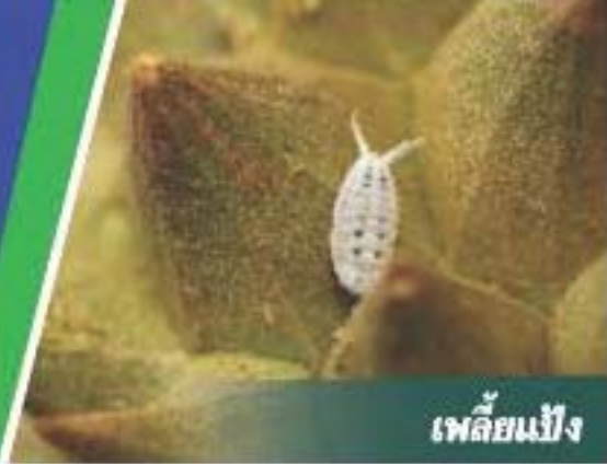
เพลี้ยแป้ง