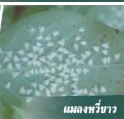
แมลงหวี่ขาว