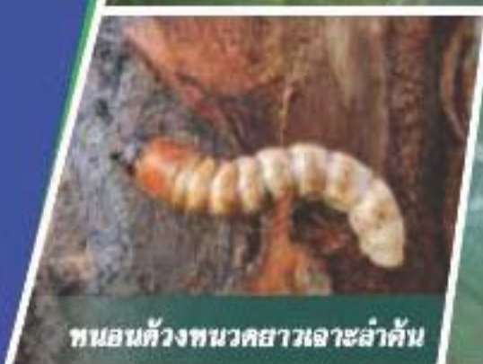
หนอนตัวงวงทวยขาวเจาะลำต้น