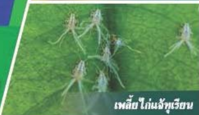
เพลี้ย ไก่แจ้ทุเรียน