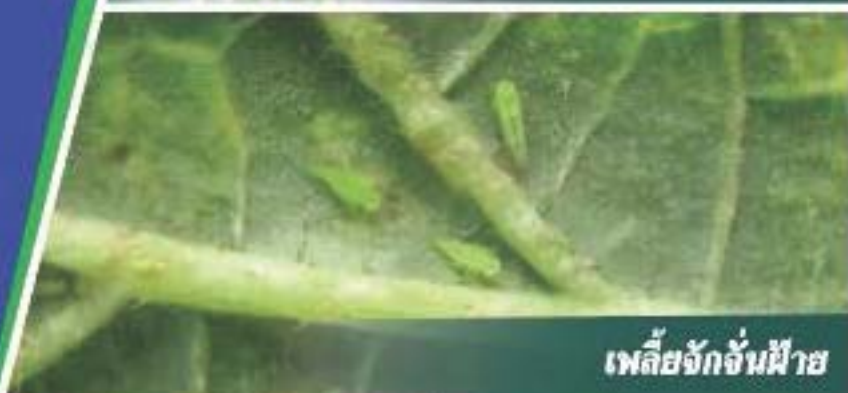
เพลี้ยจักจั่นฝ้าย