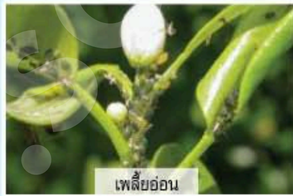
เพลี้ยอ่อน