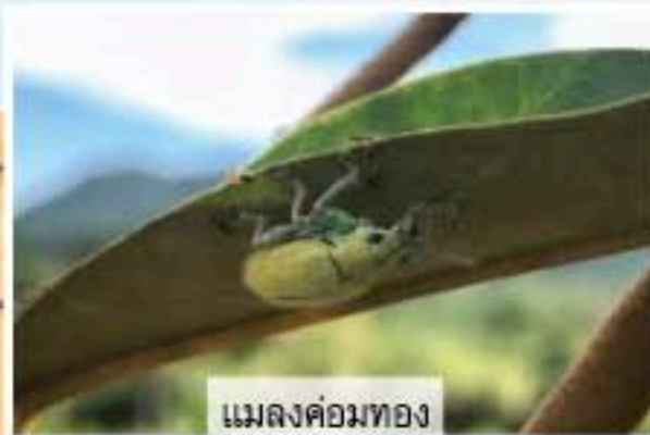
แมลงค่อมทอง