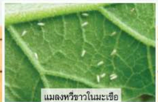
แมลงหวี่ขาวในมะเขือ