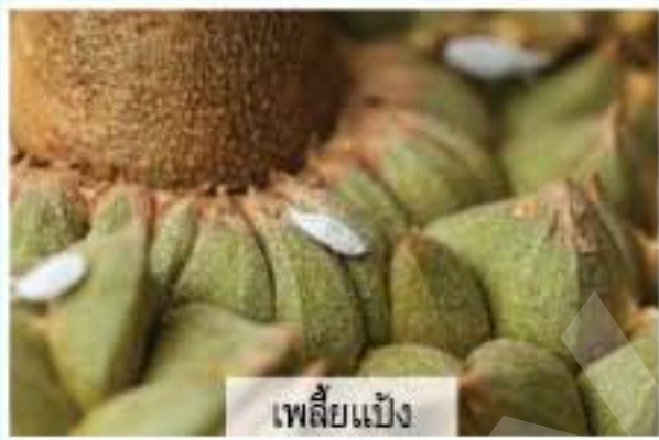
เพลี้ยแป้ง