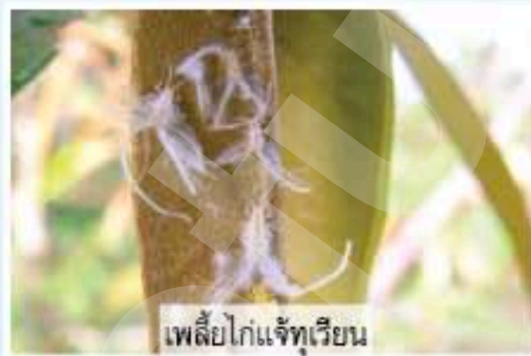
เพลี้ยไก่แจ้ทุเรียน