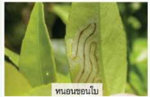
หนอนซอนใบ