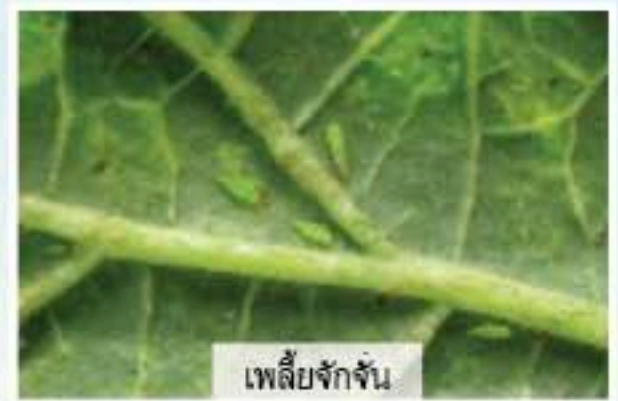
เพลี้ยจักจั่น