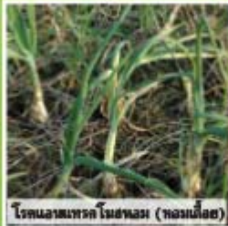
โรคแอนแทรกซ์ใบชะอม (ทองเหมือด)