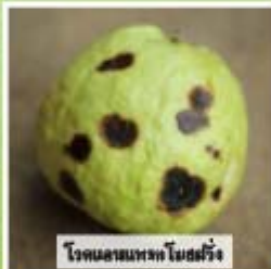
โรคแอนแทรกซ์ใบฝรั่ง