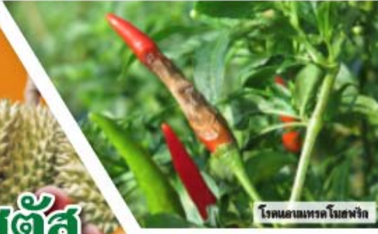
โรคเน่าบนผิวของพริก