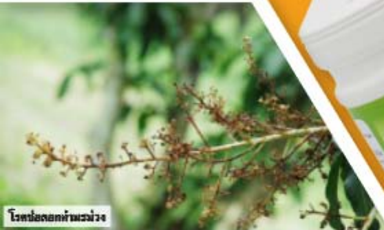
โรคน้ช่อดอกแห้งเหี่ยว