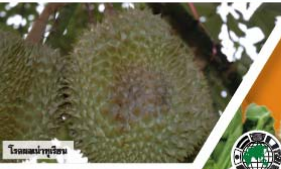
โรคผลเน่าทุเรียน