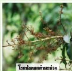
โรคช็อคดอกมะม่วง