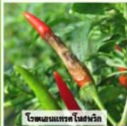
โรคแอนแทรกซ์ใบฝรั่ง