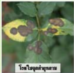
โรคใบจุดดำทุเรียน