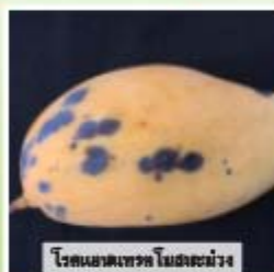
โรคแอนแทรกซ์ใบมะม่วง

อัตราแนะนำ : ชั้วรา 10-20 มิลลิลิตร ต่อน้ำ 20 ลิตร พ่นให้ทั่วทุก 7 วัน