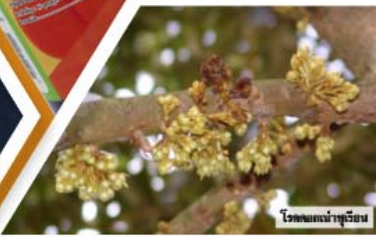
โรคพบน้ช่อดอกเหี่ยว