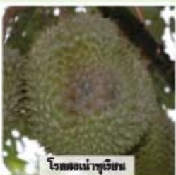
โรคของเน่าทุเรียน