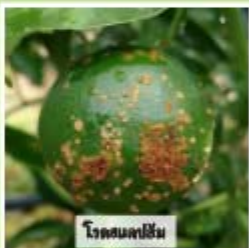
โรคผลเน่าส้ม