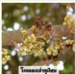
โรคดอกเน่าทุเรียน