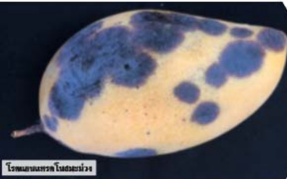
โรคเน่าบนผิวของมะม่วง