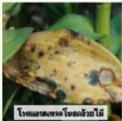
โรคแอนแทรกซ์ใบยอดข้าวโพ่