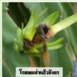
โรคของเน่าฝรั่งมังคุด