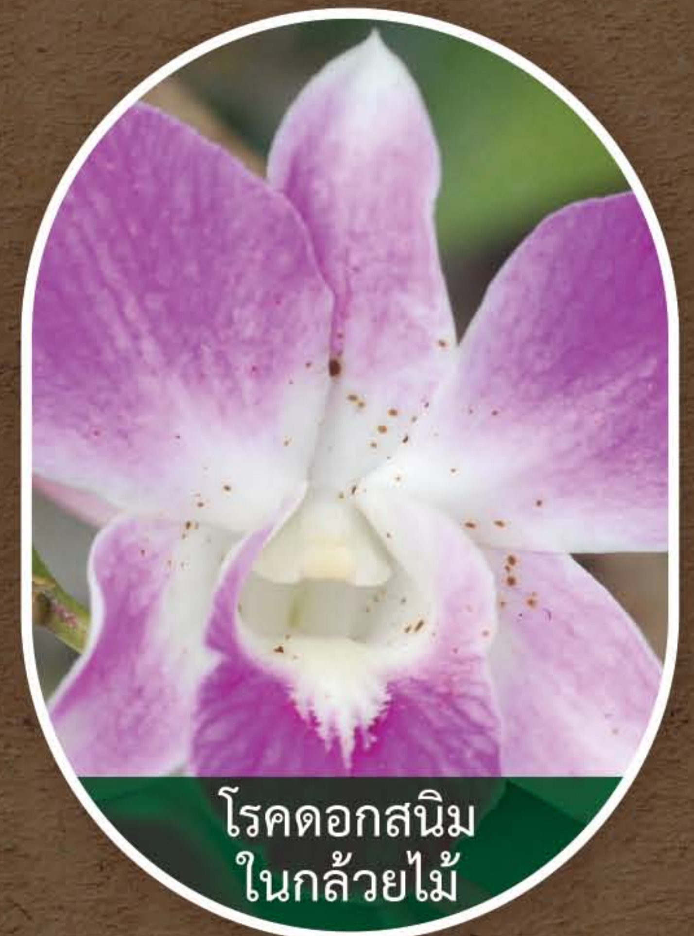
โรคดอกสนิม ในกล้วยไม้