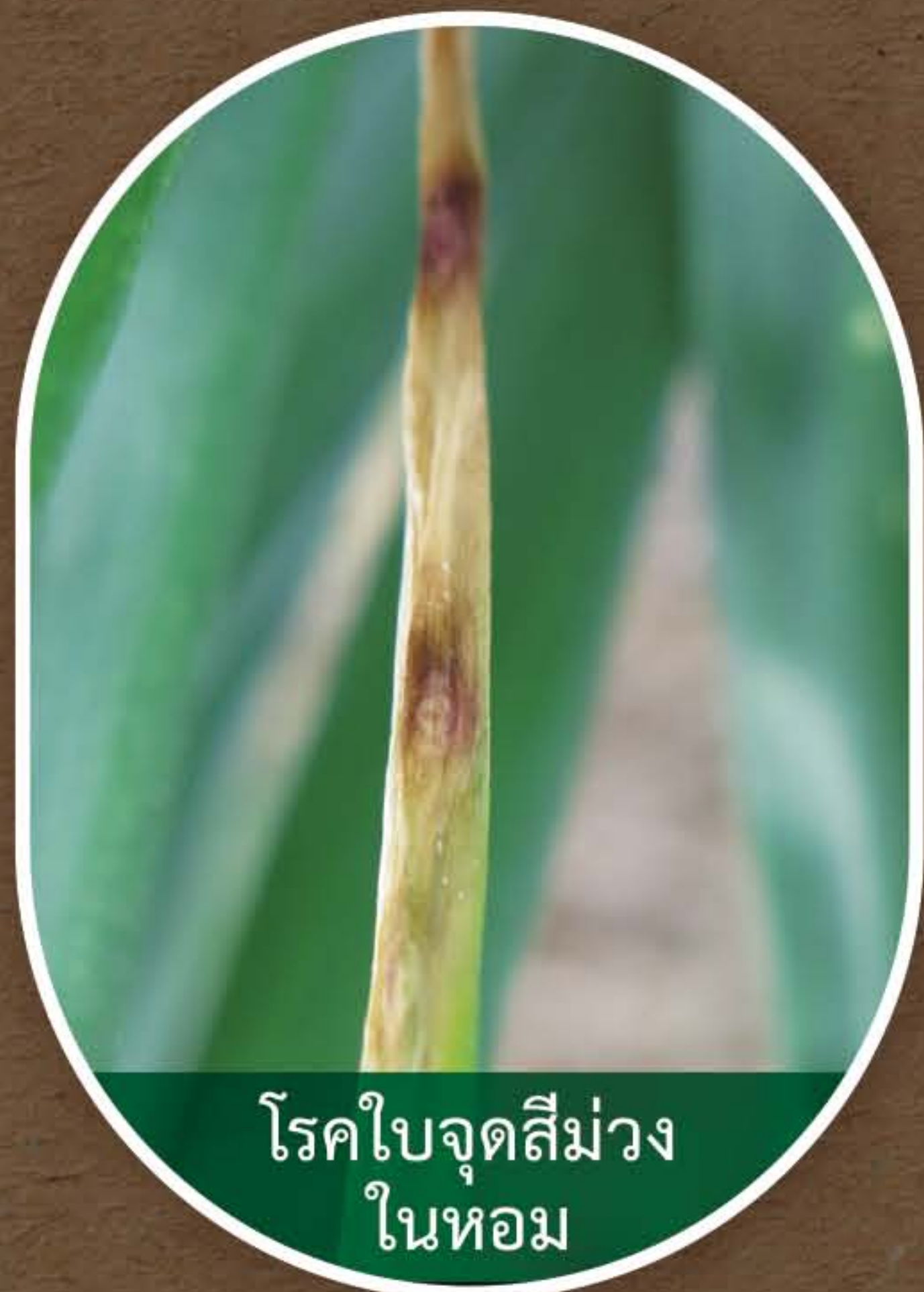
โรคใบจุดสีม่วง ในหอม