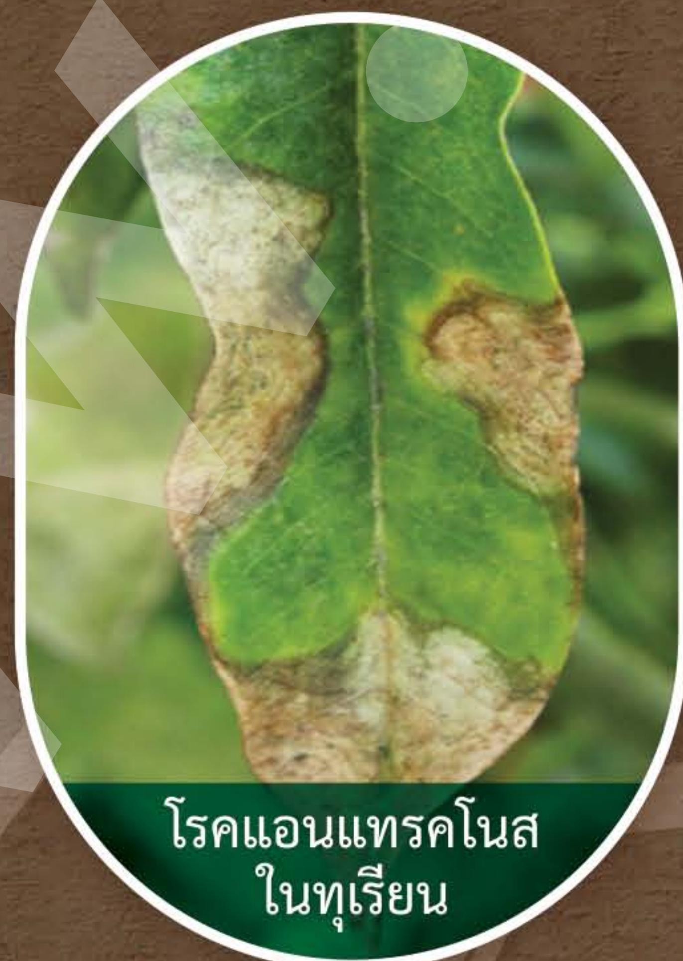
โรคแอนแทรคโนส ในทุเรียน