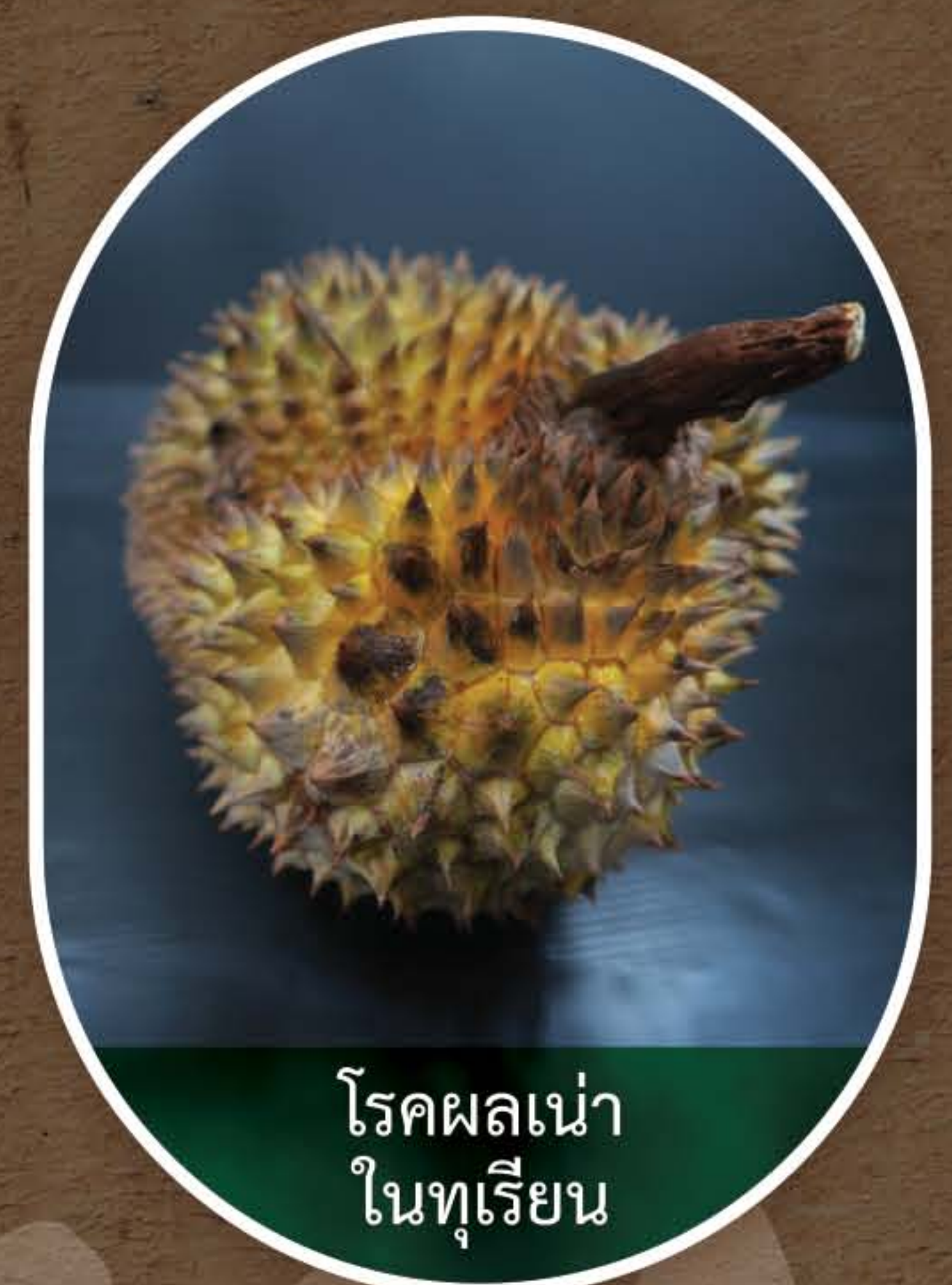
โรคผลเน่า ในทุเรียน