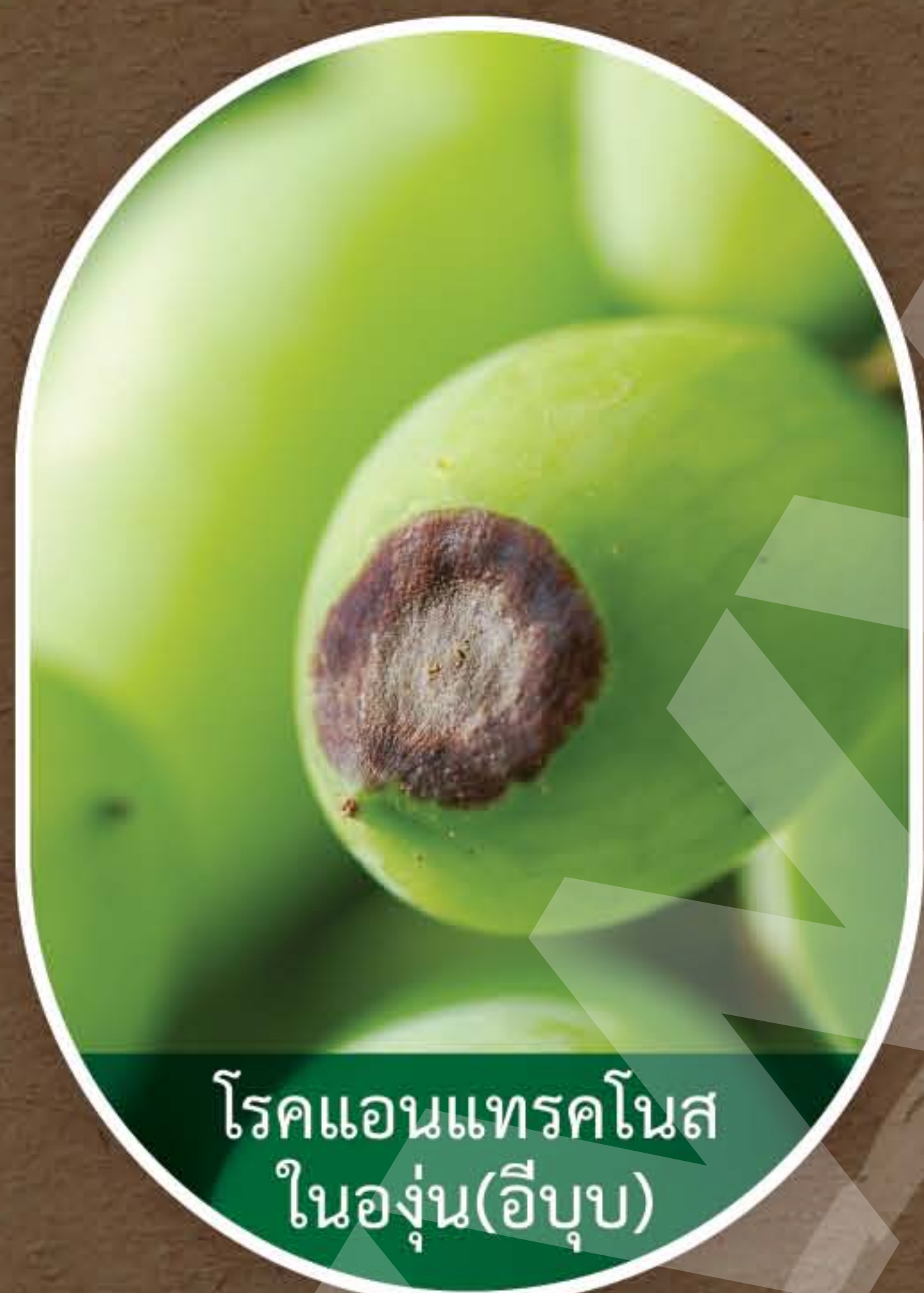
โรคแอนแทรคโนส ในองุ่น(อึบวบ)