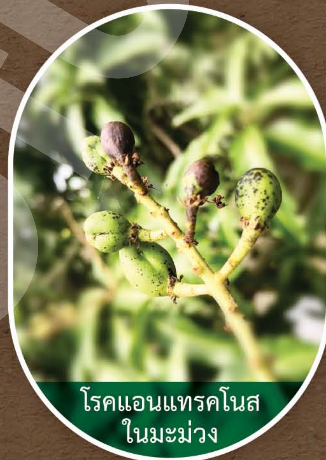
โรคแอนแทรคโนส ในมะม่วง