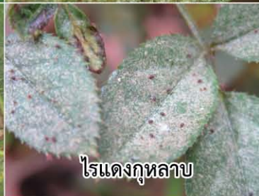
ไรแดงกุหลาบ