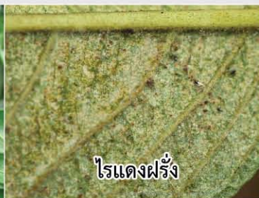
ไรแดงฝรั่ง