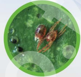
กำจัดไรระยะตัวอ่อน