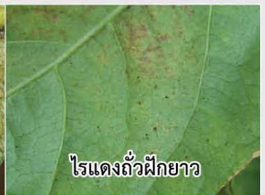
ไรแดงถั่วฝักยาว