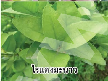
ไรแดงมะนาว