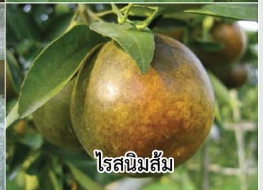
ไรสนิมส้ม