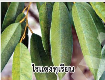
ไรแดงทุเรียน

วิธีใช้ : ใช้อัตรา 20-40 ซีซี ต่อน้ำ 20 ลิตร พ่นให้ทั่วเมื่อพบการระบาด