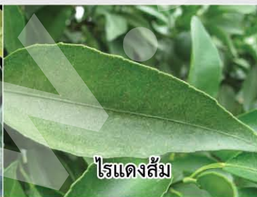
ไรแดงส้ม