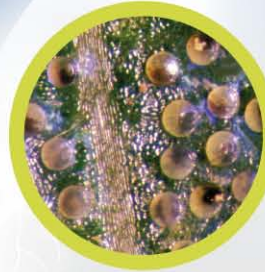
คุมไข่ไรไม่ให้ฟัก

เช่น ไรแดงแอฟริกัน ไรสองจุด ไรแมงมุม ไรสนิมส้ม