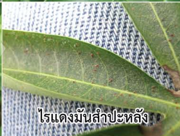
ไรแดงมันสำปะหลัง